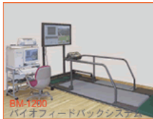
BM-1200 バイオフィードバックシステム