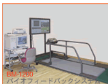
BM-1200 バイオフィードバックシステム